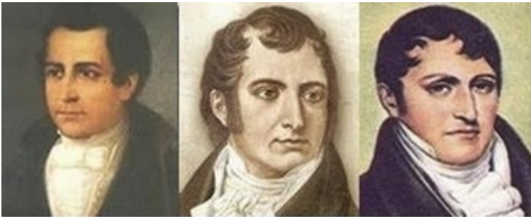
Moreno - Castelli - Belgrano

A los periodistas suscriptos a esta Fundación, les hacemos llegar individualmente nuestros saludos y recuerdos, compartiendo este día especial con ellos y con todos los comunicadores sociales, por el constante esfuerzo que hacen, para informar y mejorar la calidad de vida de los habitantes de nuestra patria.